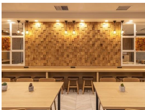
スーパーホテル広島天然温泉・薬研堀通り