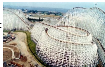
長島スパークランド「ホワイトサイクロン」

都市部で木材を活用し、山間部に価値を還元することで持続可能な社会の実現を目指しています。